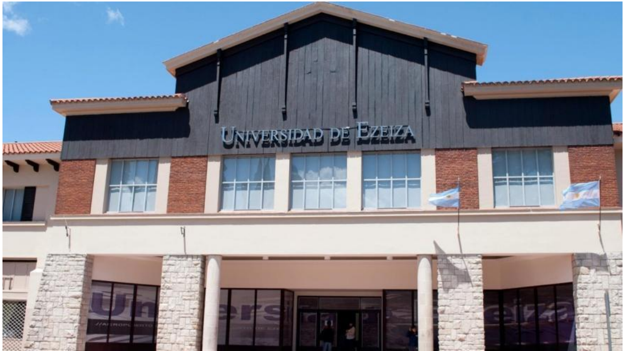
Figura 3. Imagen de la Universidad Provincial de Ezeiza