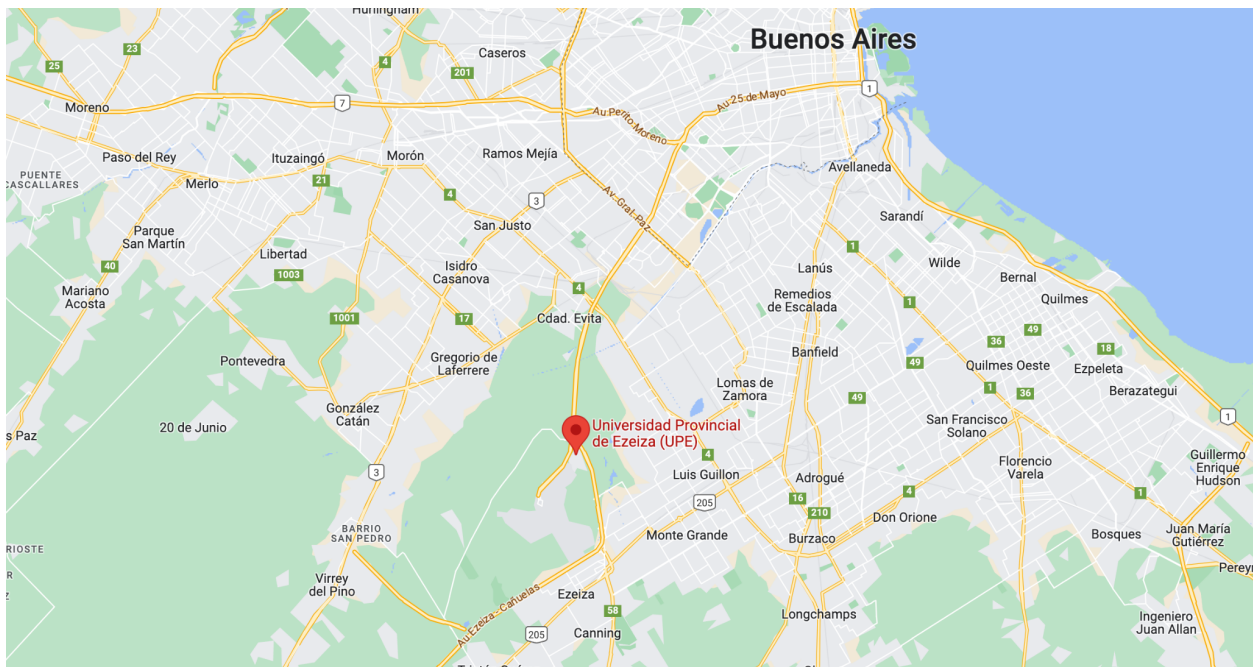
Figura 4. Imagen satelital de la localización de la Universidad Provincial de Ezeiza

La universidad tiene un emplazamiento geográfico estratégico respecto del crecimiento económico, demográfico y de oportunidades laborales del distrito y de la región. La UPE, ubicada en el tercer cordón del conurbano bonaerense, actúa como bisagra entre el área metropolitana (AMBA) y sectores en crecimiento del interior de la provincia de Buenos Aires, como Cañuelas, Lobos, San Vicente, Presidente Perón, entre otros. La demanda de oferta de educación superior creciente potencia las capacidades existentes en cada región, en especial cuando se contempla la cobertura de áreas de vacancia. Si bien Ezeiza comparte junto a las universidades de Moreno, José C. Paz, Avellaneda, Merlo y Florencio Varela su pertenencia al grupo de partidos del Gran Buenos Aires, éstas se localizan en zonas urbanas consolidadas, en mayor o menor grado, tanto demográfica como industrialmente.